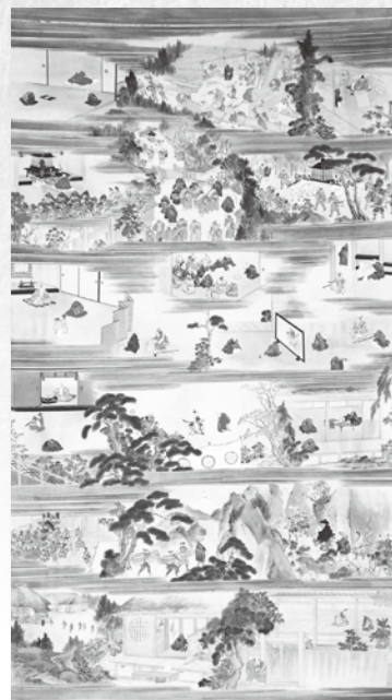
「中祖宝光坊御絵伝」聖運寺蔵