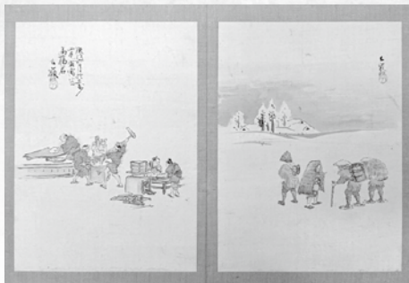
「風俗画帖」西尾市教育委員会蔵