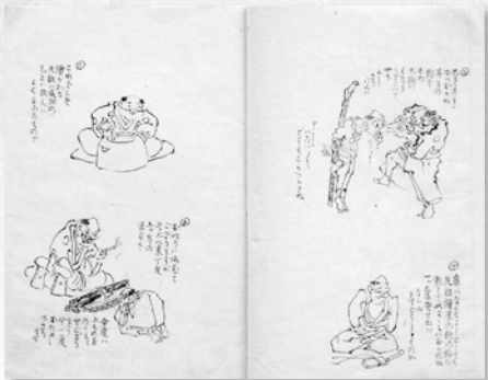
「俗諺戯画」西尾市教育委員会蔵